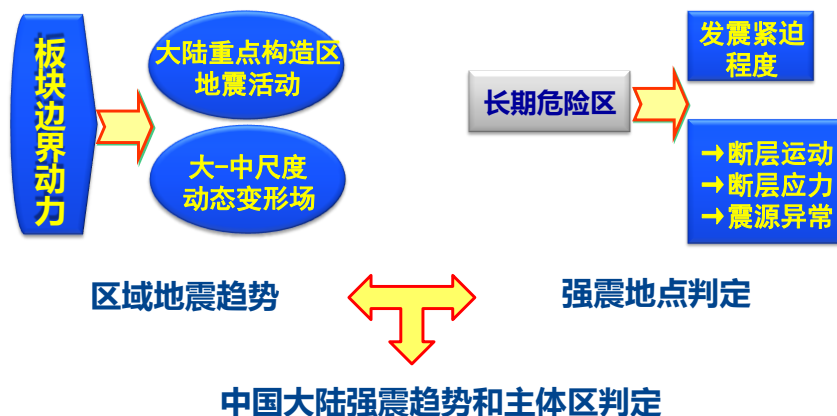
图1 地震大形势跟踪工作思路